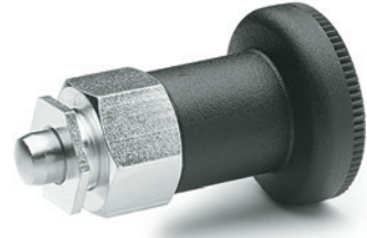
Esempio di applicazione

Bisogna tenere in considerazione che, a seconda dello spessore del laminato "s", il puntale potrebbe non rientrare completamente.